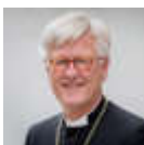
Heinrich Bedford-Strohm Landesbischof und Vorsitzender des Rates der EKD

„Beten gehört wahrscheinlich zu den intimsten Dingen, die es im Leben eines Menschen gibt.“